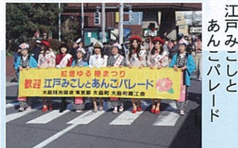
江戸みこしとあんこパレード