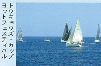
トウキョウズ・カップヨットフェスティバル