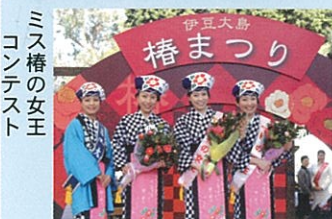
ミス椿の女王コンテスト