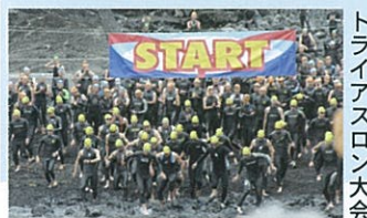
トライアスロン大会