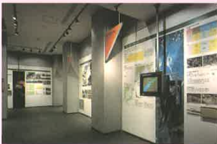
▲火山展示室2 火山の百科