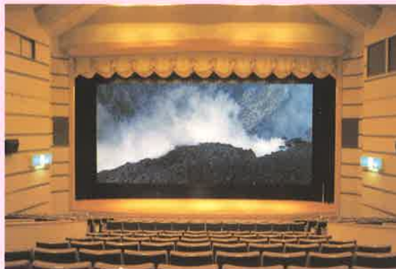
▲ワイド・スコープ映画

伊豆大島火山博物館は、世界にも数少ない火山専門の博物館です。火山最前線・世界の火山紀行・火山の百科の展示室のほか大島の美しい自然と人々の生活の様子を迫力のワイド・スコープ映画で見せる映像ホール(300席)、シュミレータ・カプセル(8席)で火山地底探検もできるユニークな博物館です。