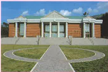
▲伊豆大島火山博物館