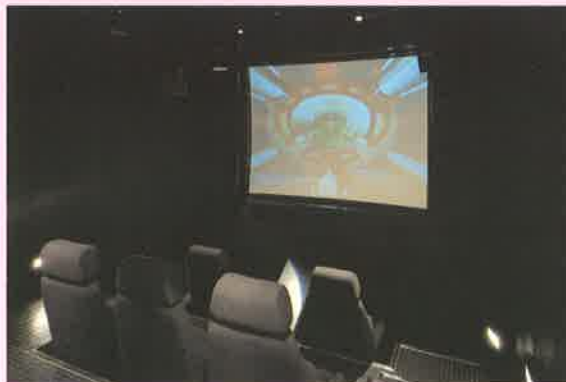
▲シュミレータ・カプセル