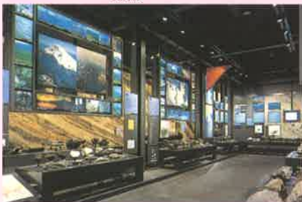
▲火山展示室1 世界の火山紀行