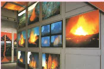
▲防災展示室 火山最前線