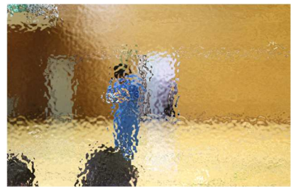
〈サッカー部：選手による紹

第1学年17名（男子8名 女子9名）、第2学年14名（男子9名 女子5名）、第3学年12名（男子6名 女子6名）、令和6年度第二中学校の学校生活のスタートです。