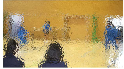
〈テニス部：ボレー & ボレー〉