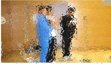
〈生徒会：学校生活の紹介〉