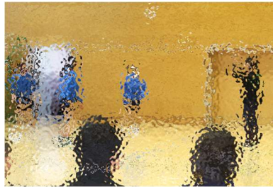
〈バレー部：パス練習〉