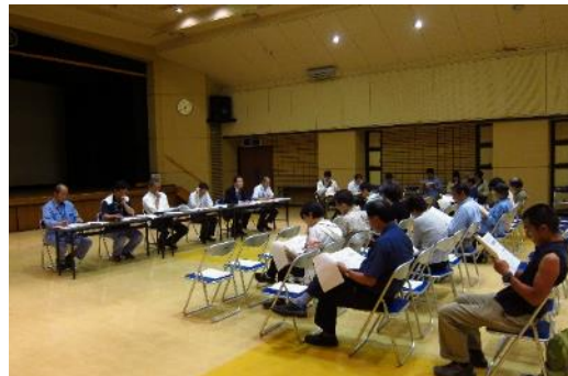
▲第1回復興まちづくり連絡会の様子

今年度、土砂災害復興推進室は、復興整備係と用地係を新設し、職員も10名体制となりました。被災された方々の生活再建支援や元町地区の復興まちづくり事業を、全力で進めてまいります。