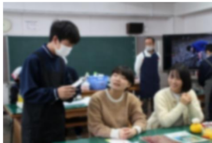
お客様の注文をうかがう ホールマネージャー