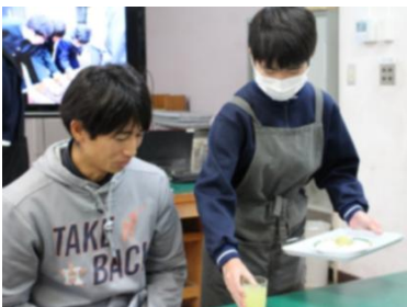
ドリンクを提供する サービスマネージャー

くろしおカフェを、12月24日のクリスマスイブに教職員向けにオープンしました。今回は、ドリンクに夏みかん、フードに大根・銀杏・サツマイモをメインとしたサービスを行いました。1学期よりもレベルアップした接客や、丁寧なキッチン対応を行うことができました。今回のメニューについては、食物の栽培から収穫、調理までを自分たちで行い、自分たちの力で計画を立てながらカフェを開くことができました。また、職業学習の一環として、仮想売り上げや収益の使い道について考える活動にも取り組み、将来につながる学習とすることができました。今回の経験を今後の活動にも生かし、さらなる成長の糧としてほしいと思います。