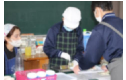
夏みかんソーダを準備する キッチンディレクター

2学期は、さまざまな行事への取り組みを通して、くろしお学級の生徒たちが互いに連携し、意見を交わしながら活動する姿を見ることができました。それぞれの個性を生かし、良さを学習活動の中で発揮することができていたように思います。3学期も、くろしお学級は前向きに、それぞれのレベルアップを目指して活動していきます。