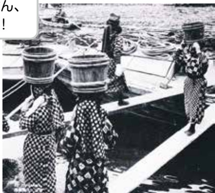
【写真1:荷物を運ぶアンコさん】