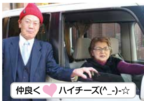
仲良く♡ ハイチーズ(^_-)☆

「ナイスショットおおしま」のコーナーは住民のみなさんからの写真も募集しています。広報に掲載してみませんか？