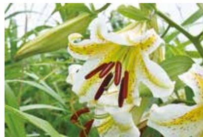
山頂カルデラのサクユリ