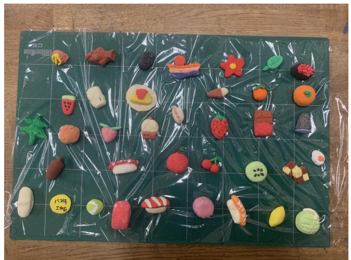
大島の動物、名産品（卒業記念品作成）

※裏面に地域人材や地域素材を活かした令和7年度の実践をまとめてあります。是非ご覧下さい。