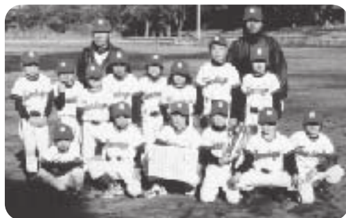
Bブロック優勝 元町サンデーズ

11月30日(日) 旧北の山小学校グラウンドで、右記大会決勝戦が行われました。Aブロックは、北の山モーニングスが差木地パンサーズと対戦し、2時間50分に及ぶ熱戦を繰り広げ、今大会3年ぶりの優勝を勝ち取りました。Bブロックは、元町サンデーズが波浮リトルハーバーズと対戦し優勝しました。