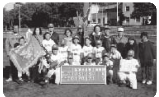
Aブロック優勝 北の山モーニングス