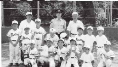
差木地パンサーズB