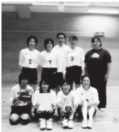
女子優勝 ANKOニシャーズ