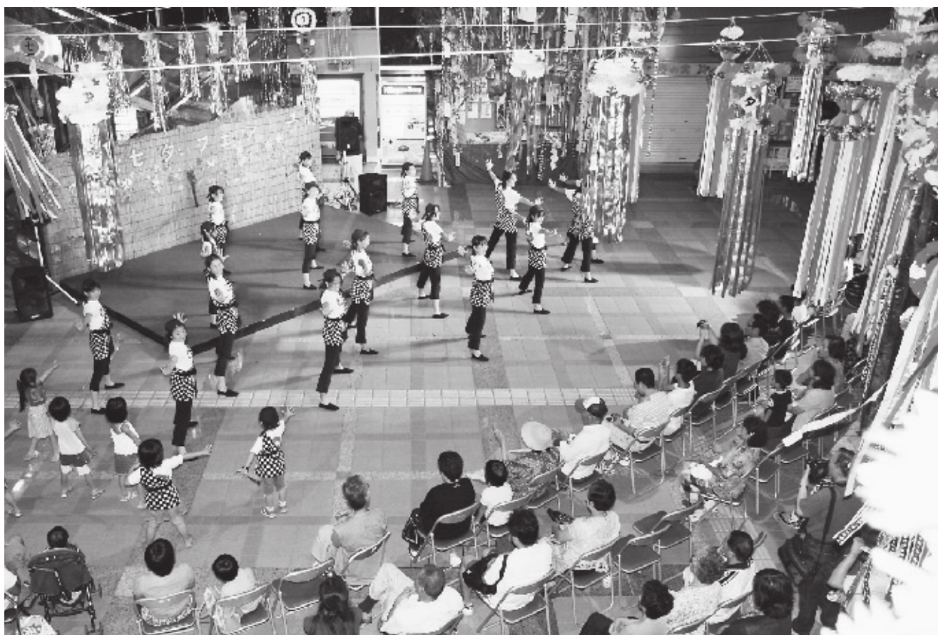
7月16日伊豆大島七夕フェア（元町港船客待合所にて）