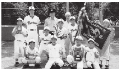
差木地パンサーズA

閉会式では、長い間野球を通じて島の子どものための健全育成に貢献された、代表、監督、コーチ、審判員の17名の方が表彰されました。