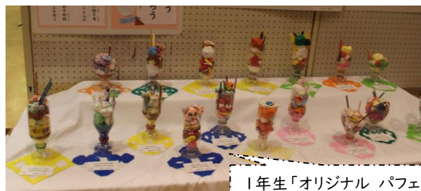
1年生「オリジナル パフェ」

令和8年1月16日(金)から20日(火)までの5日間、「第29回 大島町立小中学校連合作品展」が、開発総合センター2階にて開催されました。保護者の皆様・地域の皆様、たくさんのご来場をいただき、誠にありがとうございました。今年の展示作品は、図画工作科の平面作品と立体作品、家庭科の作品の全14種類の作品をご覧いただきました。どの作品も子供たちの個性が豊かに表現されました。