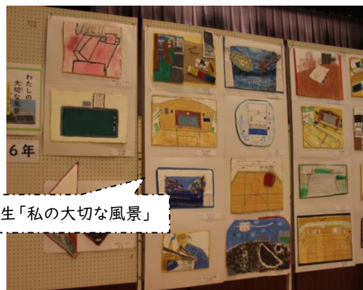
6年生「私の大切な風景」