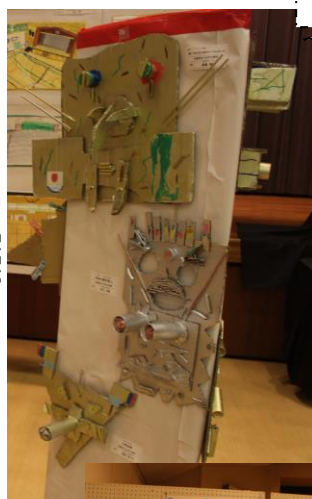
3年生「トーテムポール」