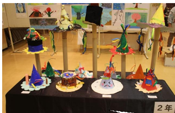
2年生「すてきな ぼうし」