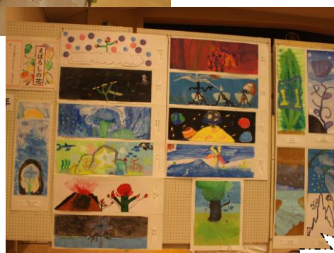
4年生「まぼろしの花」