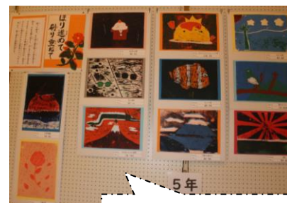
5年生「はり進み版画」