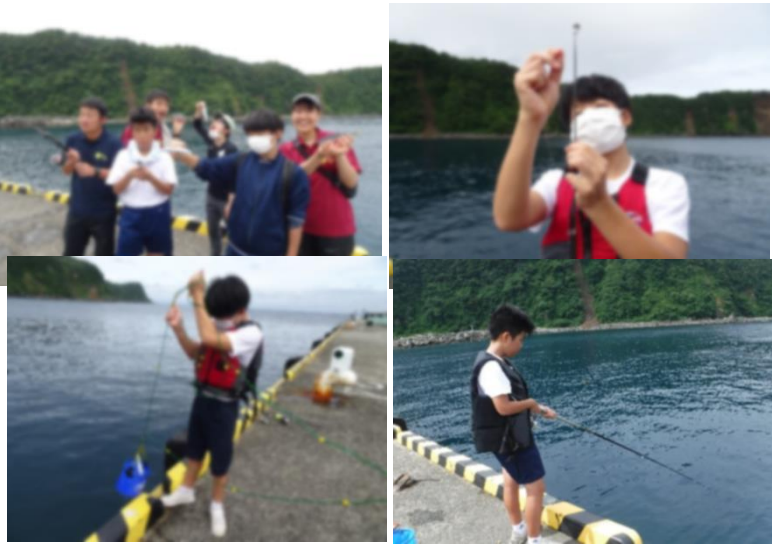
海浜実習 (釣り) (岡田港でサビキ釣りに挑戦しました)