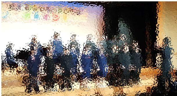
民謡メドレー「あんこ椿～大島節」

12月5日（火）開発総合センター 大集会室に、中学校3校が集まり、連合音楽会が開催されました。人数が少なく練習時間も限られた中でしたが、会場全体に声を響かせ、気持ちを込めて合唱しました。また、他校の合唱も聴き、大いに刺激をもらえた一日となりました。ご参観いただいた保護者のみなさま、ありがとうございました。