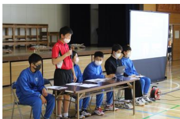
〈生徒会：学校生活の紹介〉