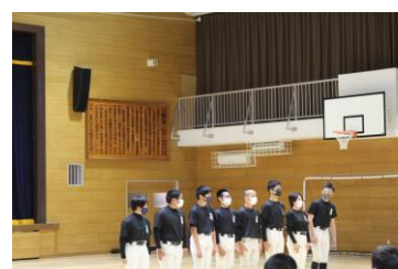
〈野球部：元気なあいさつ〉

第1学年13名（男子7名 女子6名）第2学年13名（男子6名 女子7名）第3学年28名（男子12名 女子16名）令和4年度第二中学校の学校生活のスタートです。