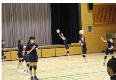
〈バレー部：パス練習〉