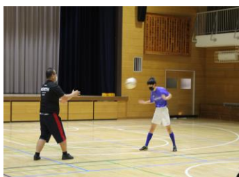
〈サッカー部：基礎練習〉