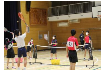
〈テニス部：ボレー & ボレー〉