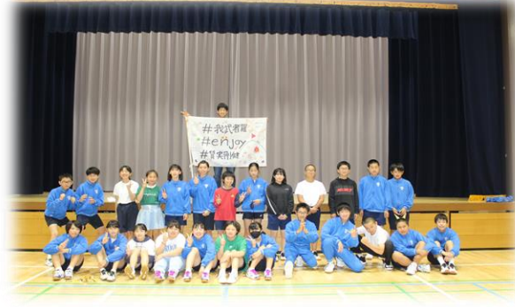
スローガン「#我武者羅 #enjoy #質実剛健」