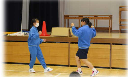
実行委員レク:「ジェスチャー伝言ゲーム」