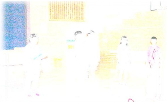
キャンドルを掲げて一人一人の決意表明