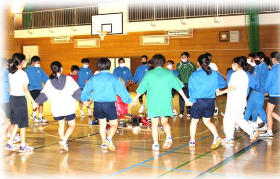
火(文化・正義・友情の象徴)を囲んで みんなでフォークダンス「マイムマイム」