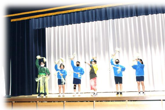
♪各班の出し物♪ ダンス・劇・クイズ・マジックショー・・・