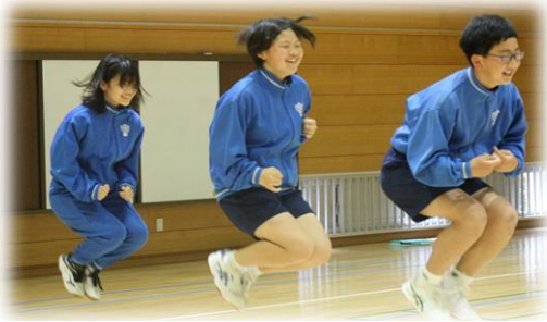
「大縄跳び」(4つのチェックポイントレクの1つ)

※13日（金）に予定していた1・2年生の合同キャンプは、悪天候・悪条件のため実施せず、14日（土）に体育館でキャンプレクリエーションを行いました。