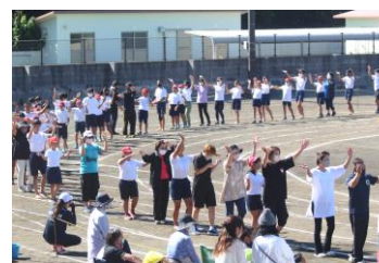
〈会場一体で踊る「あしたば音頭」〉