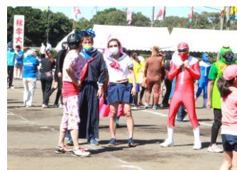
〈仮装でも楽しめる「各種団体リレー」〉

保護者・地域の皆様には、グラウンド整備や会場設営・片付け等にご協力いただきありがとうございました。また、子どもたちへの温かいご声援、大きな拍手をありがとうございました。